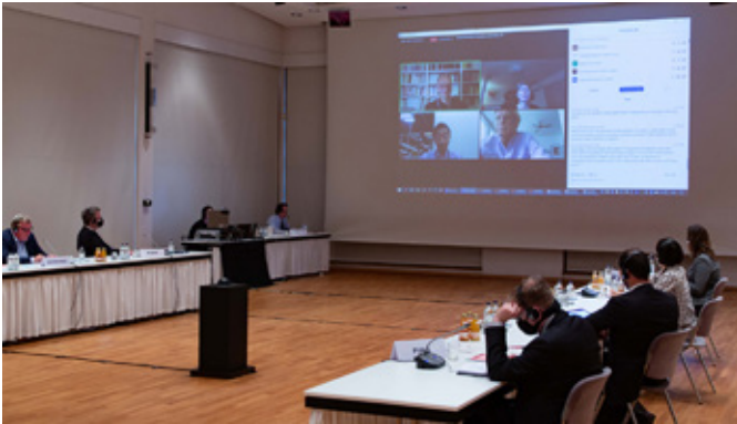
Das virtuelle Symposium „The “New Normal,” New Mobility and the Future of the City“ fand mit einem Livestream aus dem JDZB am 24. August 2020 statt. Es war die erste von mehreren Tagungen des JDZB, die pandemiebedingt hybrid (mit Teilpräsenz) durchgeführt wurden.