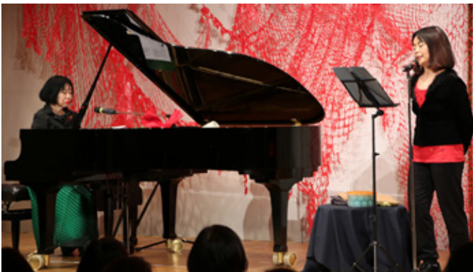
Foto oben: „Carmen X Cage“ am 15. Januar 2019: Fünf international bekannte Künstler*innen zeigen eine spannende Performance aus Musik, Klang, Wort und Kunstinstallation. Im Bild links die Jazzpianistin TAKASE Aki, rechts die Schriftstellerin TAWADA Yōko.