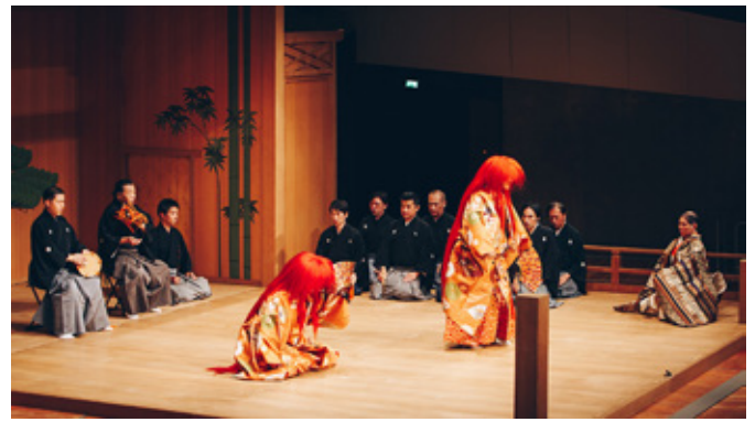
Foto oben rechts: Festliche japanische Nō-Theater-Aufführung zum 25-jährigen Bestehen der Städtepartnerschaft Berlin-Tōkyō und zum 50-jährigen Bestehen des Japanischen Kulturinstituts Köln am 3. September 2019 in der Philharmonie Berlin, im Rahmen des Musikfest Berlin in Zusammenarbeit mit der Japan Foundation und dem JDZB.