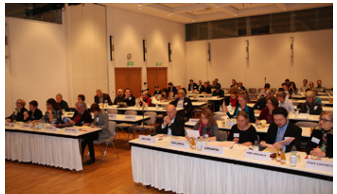
Foto rechts: Jahrestagung zum 30-jährigen Bestehen der Vereinigung für sozialwissenschaftliche Japanforschung (VSJF) zum Thema „Social Science Research and Society in Japan and Germany: Impact, Institutions and Perspectives“, 23.-25. November 2018 im JDZB.