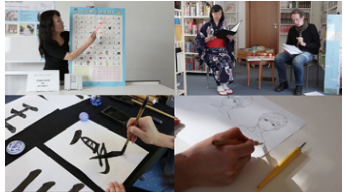
Der Tag der offenen Tür 2020 wurde ein virtueller Tag mit einem vierstündigen Video-Programm und vielen Online-Angeboten, der am 13. Juni ab 14 Uhr über die JDZB-Facebook-Seite und über YouTube gestreamt wurde – es war das erste erfolgreiche digitale Experiment.