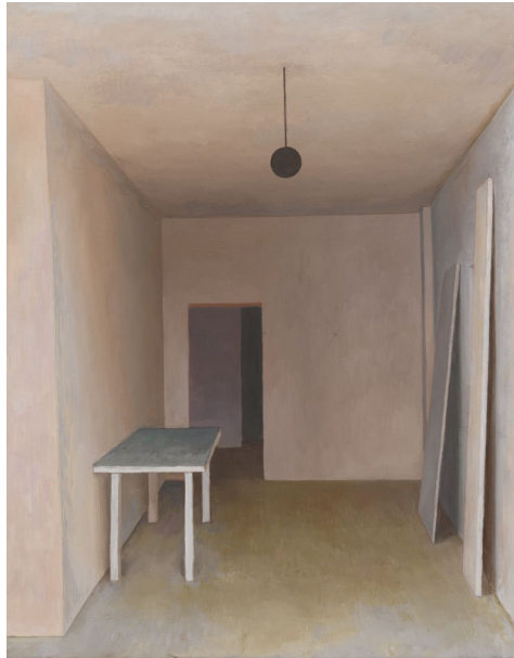
„Interieur 18“ © Albrecht SCHÄFER