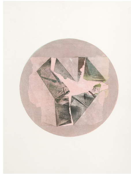
„Pliage“ © Albrecht SCHÄFER

Bekannt wurde der Künstler mit minimalistischen Eingriffen in Räume und Transformationen von alltäglichen Gegenständen. Mit einem feinen Gespür für die innere Logik von Materialien erkundet er deren künstlerisches Potenzial. Seit einigen Jahren setzt Albrecht SCHÄFER seine räumlichen Untersuchungen vorwiegend in der Malerei um. In