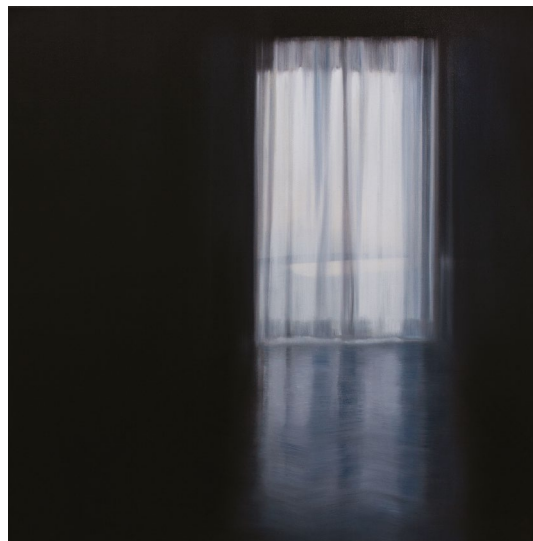
„Fenster 6“ © Miwa OGASAWARA

der Ausstellung sind zudem Arbeiten aus seiner aktuellen Serie zu sehen: Monotypien, die sich mit der Entstehung von Geometrien und Farbräumen durch Faltungen beschäftigen.