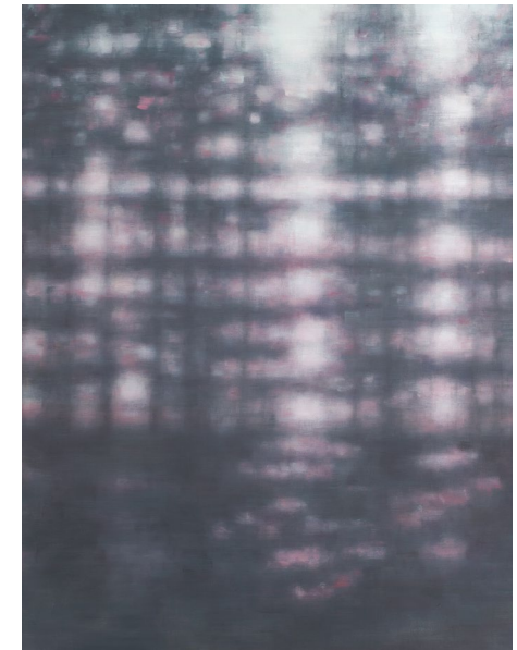
„Jahreszeit 3“ © Miwa OGASAWARA

1973 in Kyoto geboren, schloss sie ihr Studium der Bildenden Künste an der Hochschule für Bildende Kunst Hamburg ab. Ihre Arbeiten wurden in zahlreichen Einzel- und Gruppenausstellungen in Japan, Deutschland, Frankreich, den USA und zuletzt Taiwan gezeigt. Sie lebt und arbeitet in Hamburg.