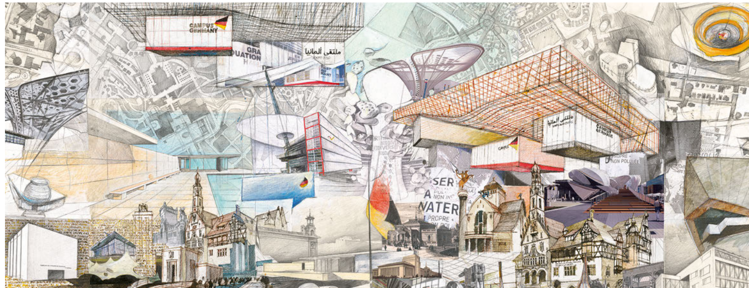
Deutsche Pavillons 1851-2020 ドイツ館 1851-2020年