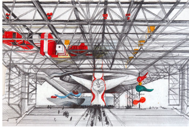
Osaka 1970, Festival-Zone 大阪 1970年 お祭り広場

Eine ausgewählte Gruppe der Bilder wird ab Februar auch auf der Außenmauer der Deutschen Botschaft in Tokyo zu sehen sein, womit sich in der Ausstellung eine Brücke nach Japan schlagen lässt.